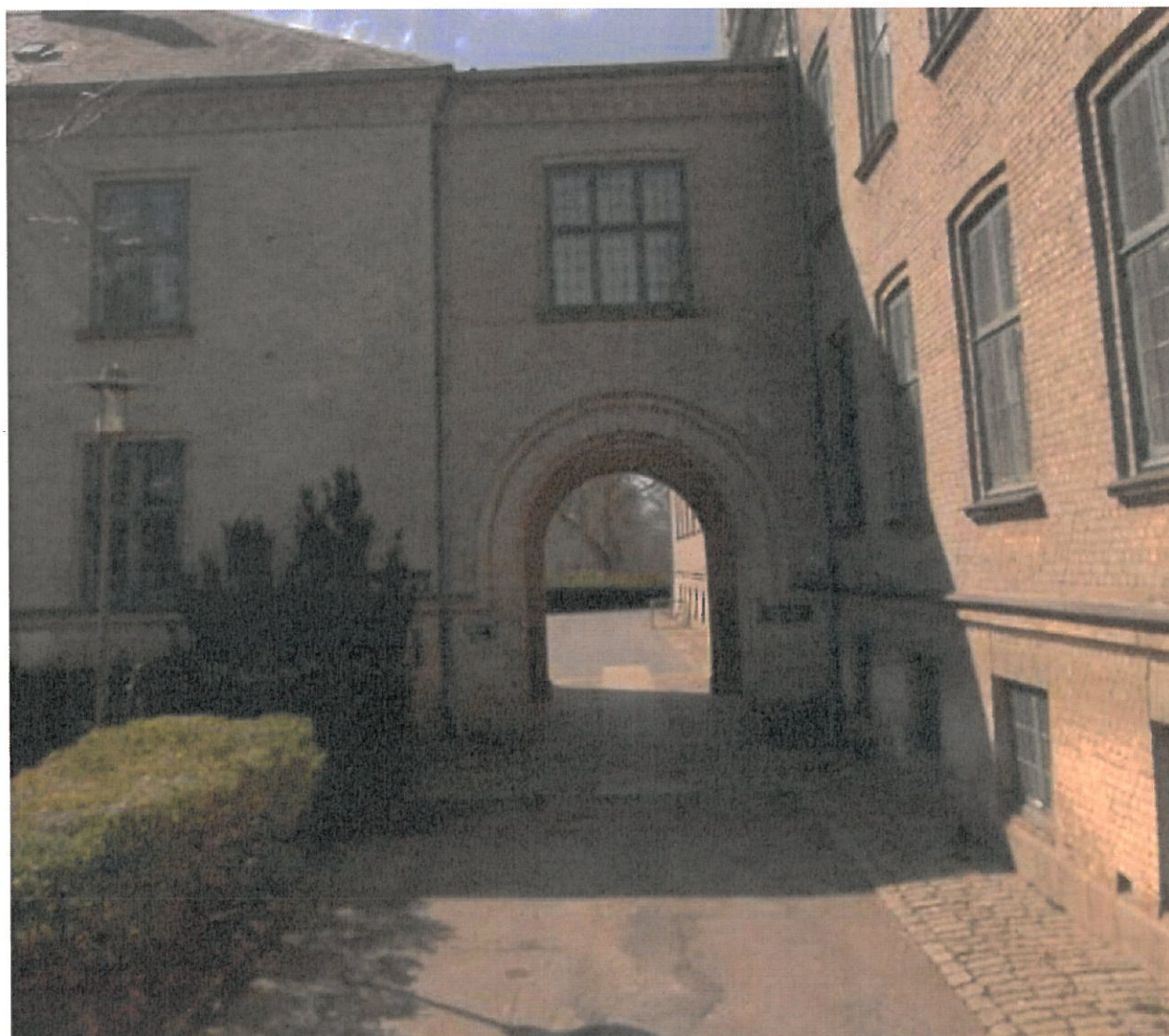
Østlig port set fra parken