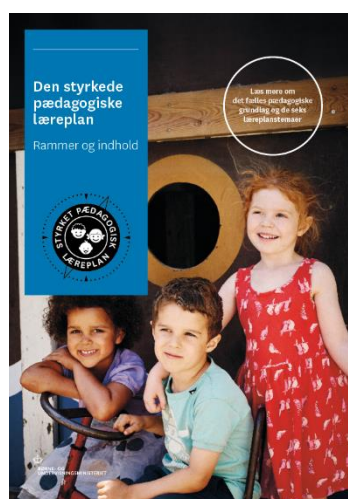
Den styrkede pædagogiske læreplan, Rammer og indhold

Denne skabelon indeholder alle de lovmæssige krav til evalueringen. Lovkravene finder I i de to midterste afsnit "Evaluering og dokumentation" og "Inddragelse af forældrebestyrelsen". Skabelonen indeholder desuden spørgsmål, som kan støtte jeres evalueringsproces samt jeres fremadrettede arbejde med løbende at revidere den skriftlige læreplan.