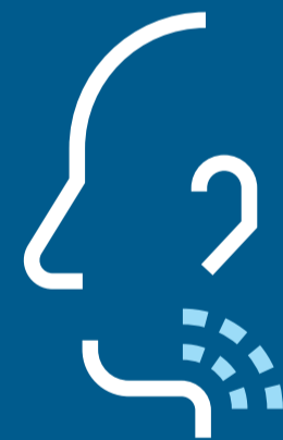
Ondt i halsen

Bliv også hjemme, hvis du er i tvivl, om du er syg. Gå i selvisolation og sørg for at blive testet.