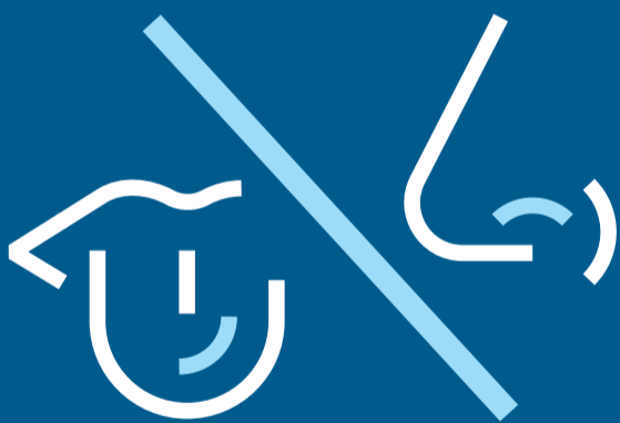
Tab af smags- og lugtesans