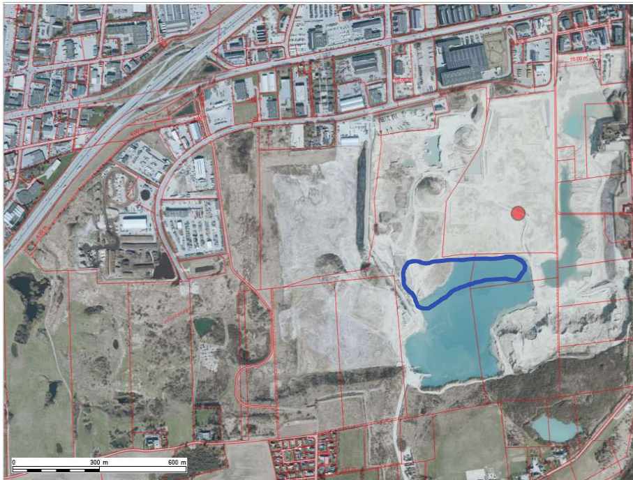
Figur 1 - Den blå ring viser ca. hvor projektområdet for nedsvinningsbassinet er i det nuværende landskab. Der er ikke tale om en målfast eller præcis illustration (udarbejdet af Roskilde Kommune).

Nedenstående illustrationer viser hvor anlægget skal placeres i forhold til det nuværende landskab og, hvordan projektet vil være placeret efter opførelse af byggeriet indeholdt i lokalplan 681.