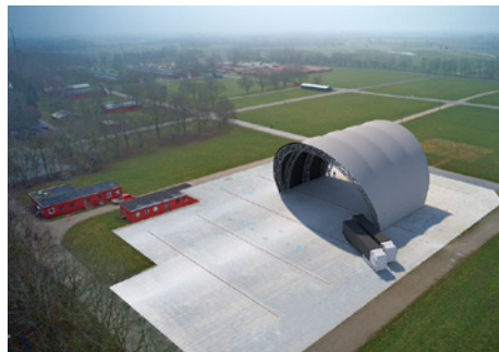
Visualiseringer af den permanente stålkonstruktion