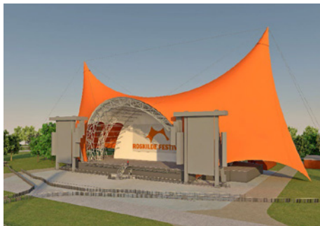
Visualiseringer af ny orange scene til festival