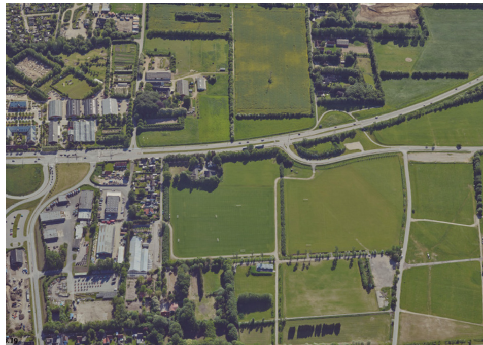
Overblikfoto over Målfeltet, der er under udvikling

Dyrskuepladsen og Milen er en fælled, der skal være rig på oplevelser og biodiversitet. Områdets bynære placering har et vigtigt potentiale for naturoplevelser for borgere i hverdagen, men også for at skabe en grøn oplevelse til arrangementerne. Der vil i de kommende år blive igangsat flere initiativer for udvikling af mere natur og beplantningen i områderne.