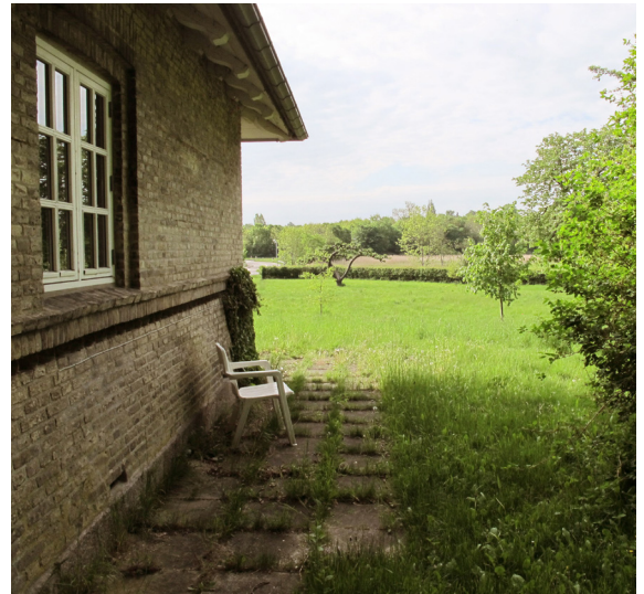
Bygningen ligger smukt og solitært beliggende i landskabet.