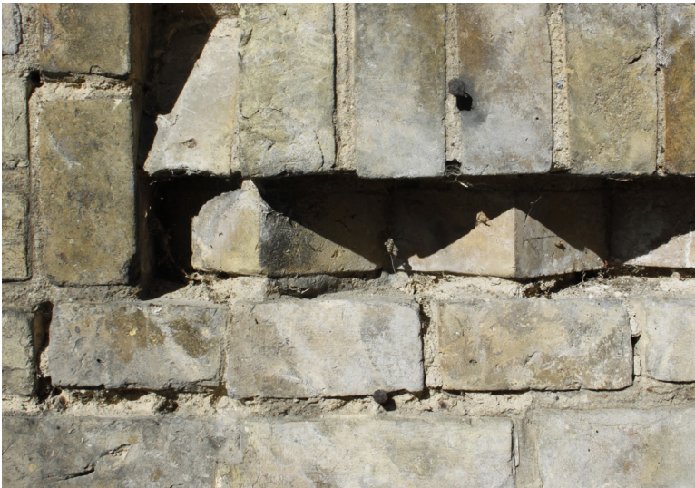
De gennemgående murværksdetaljer fra Kurhuset går også igen i portbygningen.