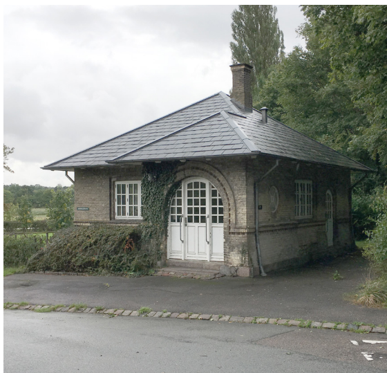
Sønderports østfacade set fra Søndre Allé