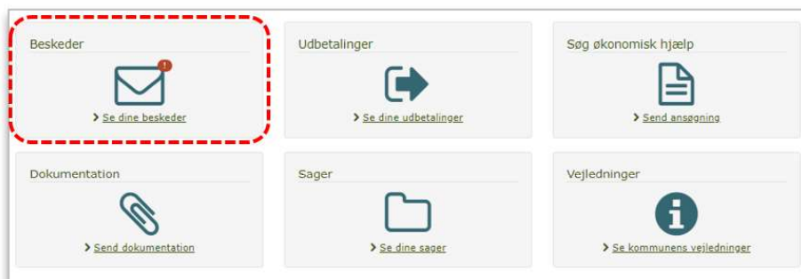
Billede 1: Se dine beskeder fra overblikket

Det røde udråbstegn vil kun være der, hvis du mangler at sende dokumentation til kommunen.