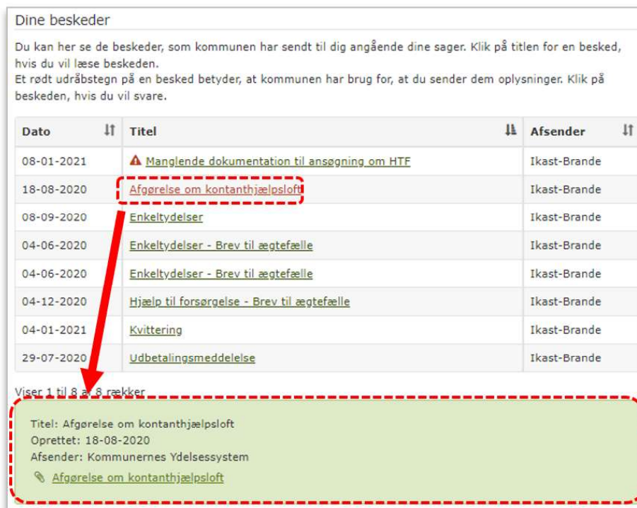
Billede 2: Dine beskeder

Klik på linket med papirclip ikonet 'Afgørelse om kontanthjælpsloft' og hele beskeden åbnes.