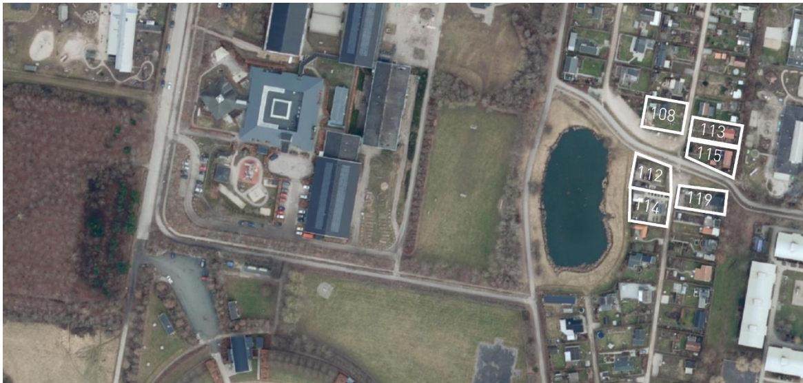
Oversigt: Beliggenhed for kolonihaver, der står til nedlæggelse

Roskilde Byråd besluttede derfor i august 2022, at de seks kolonihaver i HF Solvang skal nedlægges. Forudsætningen for beslutningen var, at de seks kolonihave-lejere skal kunne beholde deres kolonihaver, så længe de vil. Den dag, den enkelte lejer ønsker at afstå sin have, vil Roskilde Kommune købe den til den af vurderingsudvalget fastsatte pris.