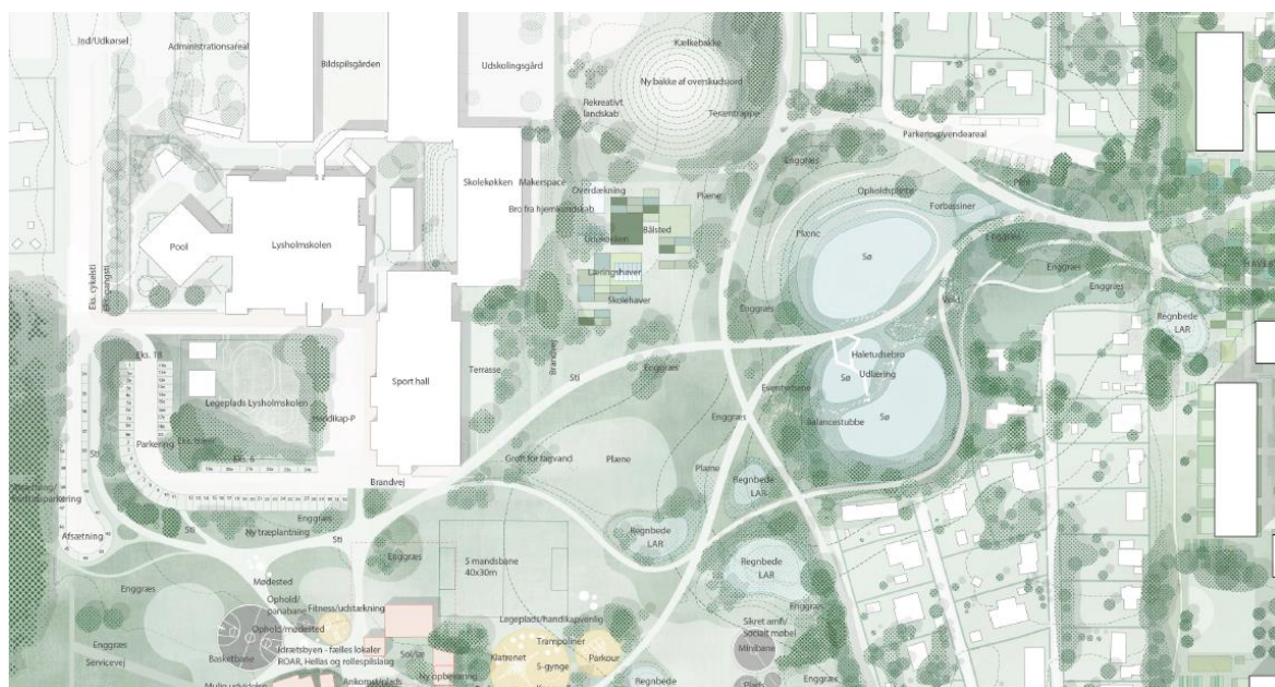
Plandisposition Byens haver 2022, vestlige parkforløb

Roskilde Kommune vurderer, at ovenstående forslag fint kan regulere nedlæggelsen af de seks kolonihaver og har i overensstemmelse hermed tilrettet afsnittet "Ændring af hovedlejekontrakt mellem Roskilde Kommune og Roskilde Haveselskab" i den endelige afgørelse.